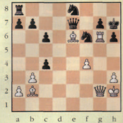
Mat en 4 coups