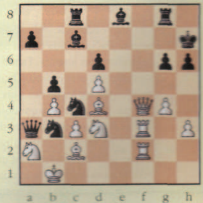
Mat en 6 coups