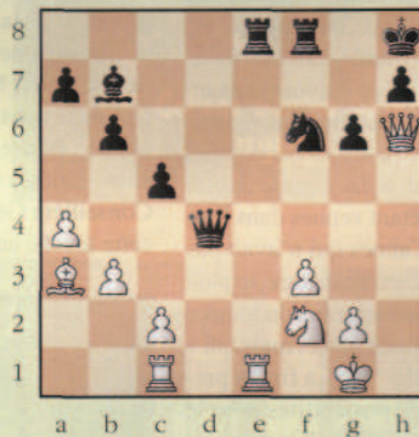
Encore du calcul