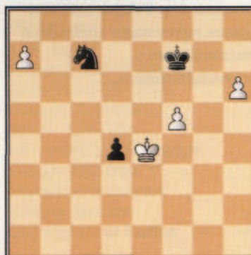
Svidler, P (2713) - Anand, V (2781) Dos Hermanas (5), 1999