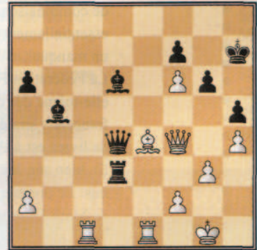
Mamedyarov, S (2542) - Tasan, A (2128) Saraybahce GP, op Kocaeli (2), 2002