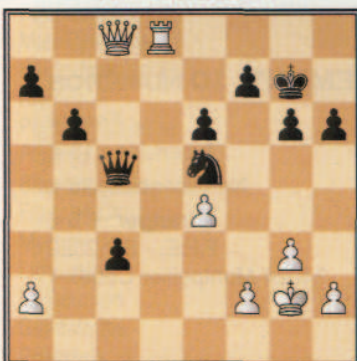
Pytel, B (2080) - Prié, É (2460) Chanac op (3), 1991