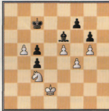
Prié, É - Marcelin, C Créon Op (7), 1999