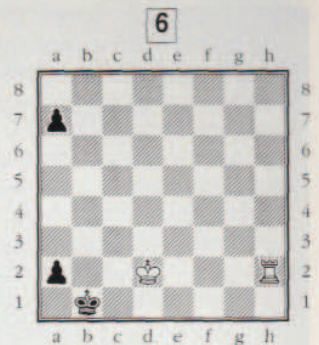
Les Blancs gagnent.

par Patrick Gonneau de l'École d'Echecs de Bagneux