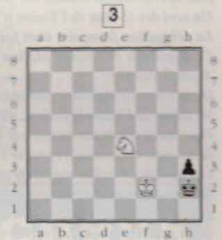
Un Cavalier suffit-il pour gagner ?