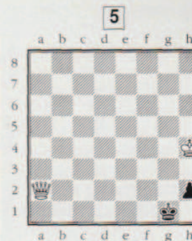
Comment mates-tu ?