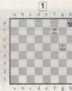
Un mat classique.

A toi de trouver les meilleures suites blanches: les mats, les gains de matériel, ou même parfois les sauvetages les plus rapides!