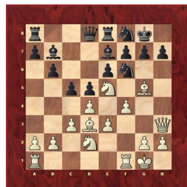
La défense solide avec Cf8