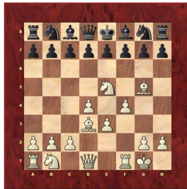
Attaque avec Dc2