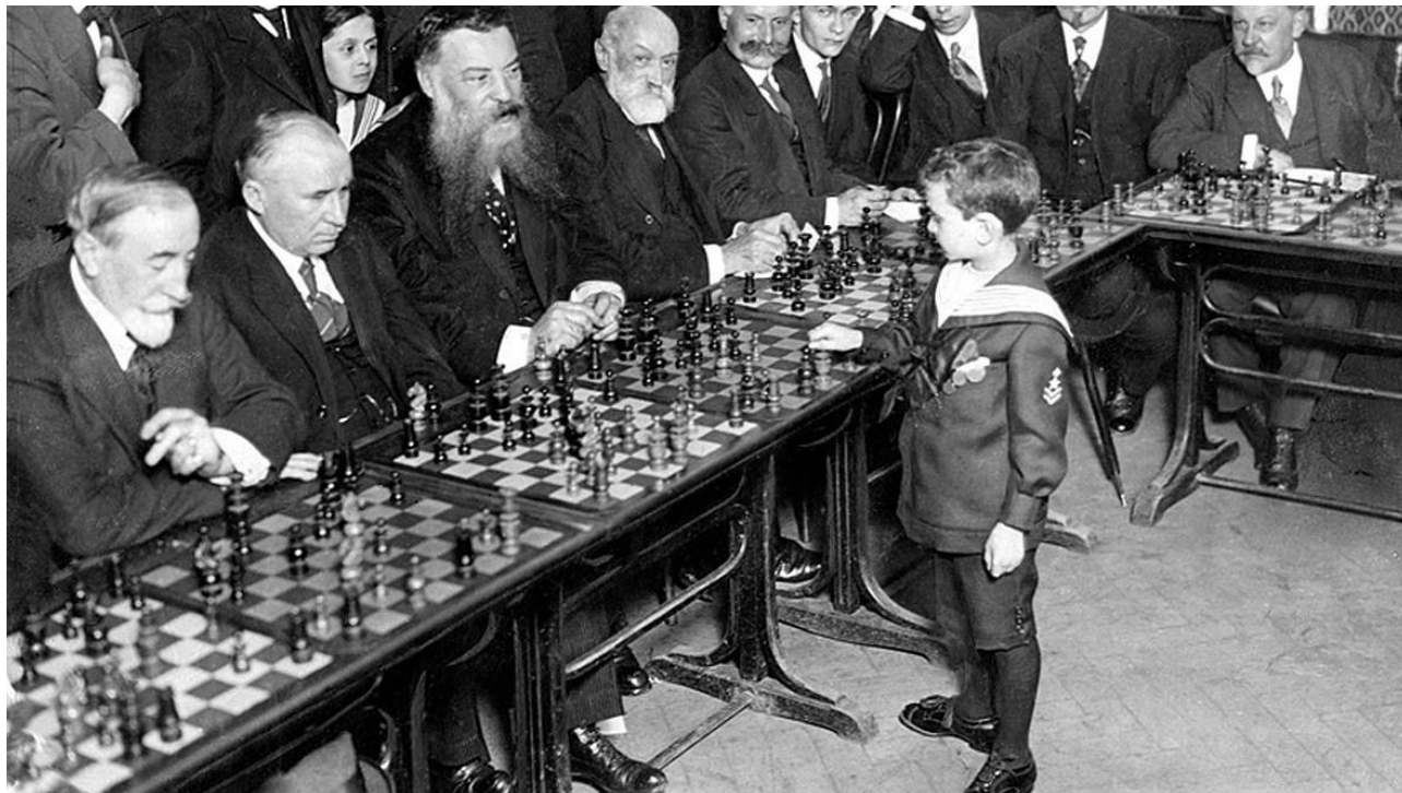
Samuel Reshevsky en simultanée.

Leur donner l'envie de jouer, d'apprendre, et enfin, les mener au tournoi poussins pour commencer, afin qu'ils deviennent aussi fort que Samuel Reshevsky, qui a huit ans, a réussi à battre les Maîtres au cours d'une partie simultanée en 1920 !!!