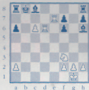
Comment négocier le pion c6 ?