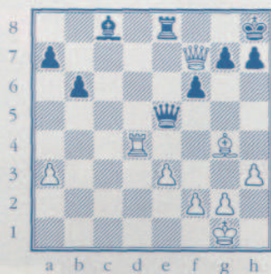
Un coup force l'abandon !