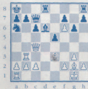
Faiblesse sur cases blanches

par Francis Meinsohn Dessin de Philippe Bron