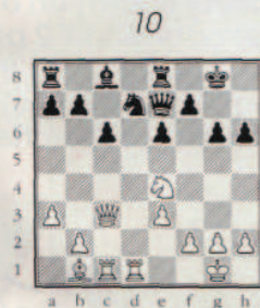
3 ème coup blanc.