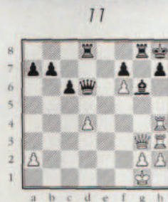
1 er coup noir.