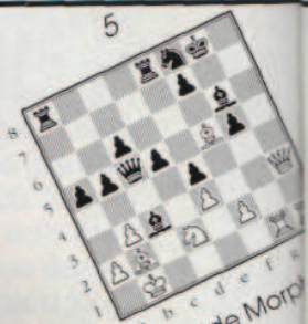
Mat de Morphy