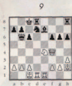
2 ème coup blanc.

Dans les positions suivantes, si le bon blitzeur sent très rapidement le premier coup, il ne le joue pas avant d'avoir poussé l'analyse... et trouvé ce qui est précisé sous le diagramme.