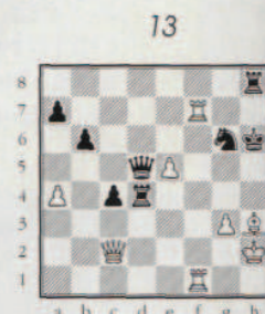
Trouver le mat.