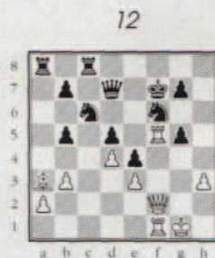
3 ème coup blanc.