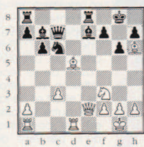
Sacrifice de chasse.