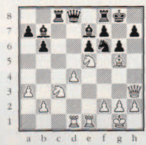
C'est devenu automatique...