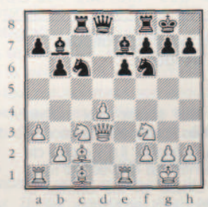
Un classique de Petrossian.