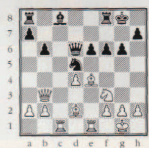
Exploitation d'une enfilade.